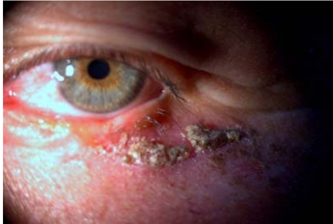
Fig.2. Apariencia de la lesión tumoral a la llegada a la consulta de oftalmología (preoperatorio).

La lesión se extendía a 3 mm por fuera del punto lagrimal inferior, tomaba todo el párpado inferior hasta más menos 3 mm por fuera del canto externo en el párpado inferior del ojo izquierdo, con una evolución de 8 meses (figura 2).