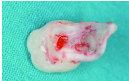
Fig. 1. Dientes primarios exfoliados con pulpa dental expuesta.

El origen y localización exacta de estas células sigue siendo incierto (Fig. 1). La producción de DPSC es muy pequeña (1 por 100 de todas las células) y según aumenta la edad del individuo, la disponibilidad de estas células se ve reducida. Se han estudiado sobre todo las células que provienen de terceros molares y dientes supernumerarios. Cabe destacar que, si son aisladas durante la formación de la corona, las DPSC son más proliferativas que si se aíslan más adelante. De cara a un uso terapéutico ha de tenerse en cuenta su interacción con biomateriales. Las células madre de la pulpa dental (DPSCs) han demostrado que pueden resolver todas estas cuestiones: el acceso al lugar donde se encuentran estas células es fácil y de escasa morbilidad, su extracción es altamente eficiente, tienen una gran capacidad de diferenciación, y su demostrada interacción con biomateriales las hace ideales para la regeneración tisular. 9