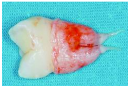
Fig.3 Diente permanente en formación, con la papila apical conservada en el extremo apical de la raíz.

La papila apical hace referencia al tejido blando situado en los ápices del diente permanente que se está formando (Fig.3). Existe una zona muy rica en células entre la papila apical y la pulpa. Es interesante destacar que, sin estimulación neurológica, las SCAP se muestran positivas para varios marcadores neurológicos, pero cuando se someten a estimulación neurológica, el número de marcadores aumenta notablemente.