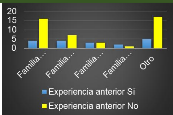
Gráfico 1. Distribución de los cuidadores encuestados según grado de parentesco y experiencia anterior en el cuidado de este tipo de enfermo.

En el gráfico 2 se muestra el nivel de conocimiento referido como Si versus conocimiento real sobre los términos enfermedad terminal (90,63% vs 48,44%), enfermo terminal (95,31% vs 56,25%), distanasia (18,75% vs 10,94%) y ortotanasia (17,19% vs 10,94%).