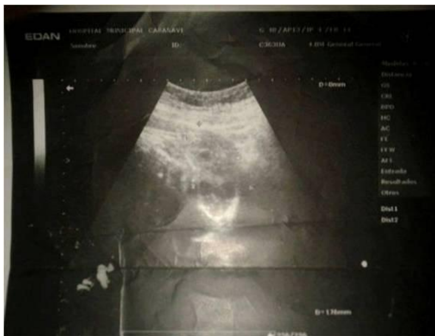
Fig. 2. Ecografía donde se observa la columna vertebral y una masa ecolúcida en la proyección del polo cefálico.