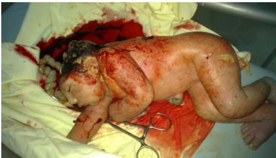
Fig. 4. Feto muerto acráneo con ausencia del hueso frontal y estructuras faciales normales.