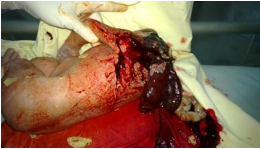
Fig. 3. Se observa feto acráneo con masa disforme en la proyección cefálica posterior.

Se realiza cesárea obteniéndose feto único acráneo, sexo masculino, peso de 3000gs, talla 48 cms (Figuras 3 y 4).