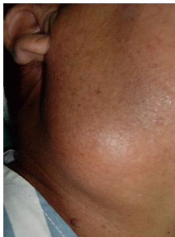
Fig.1. Quiste branquial en el lado derecho del cuello.

Todos los pacientes acudieron a las consultas externas o a las urgencias del Hospital “Carlos Manuel de Céspedes” de Bayamo. El síntoma principal en todos los pacientes fue la tumefacción indolora (100 %). La localización de la lesión presentó un predominio claro por el lado derecho del cuello (60%). Todos estaban localizados por delante del musculo esternocleidomastoideo y a la altura del hueso hioides. (Fig.1).