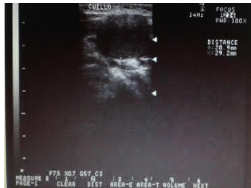
Fig.2. Imagen ultrasonografía de un quiste branquial.

En el 100 % de los pacientes se empleó el ultrasonido como medio de diagnóstico, obteniendo un patrón de presentación ecogénico. En un paciente además del ultrasonido se le realizó la TAC (Fig.2).