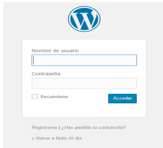
Fig. 3. Acceso al repositorio.

La Figura 4 Muestra la pantalla de administración del contenido de repositorio, desde aquí el administrador puede agregar, editar y eliminar las categorías, videos, entradas o cambiar el contenido.