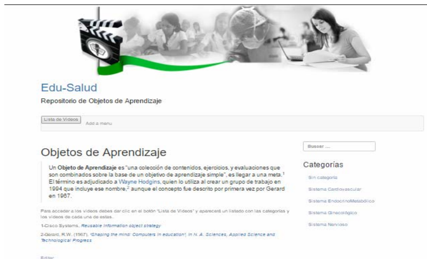
Fig. 1. Página principal del objeto de aprendizaje.

http://fcmb.grm.sld.cu/edu-salud/ . (figura 1)