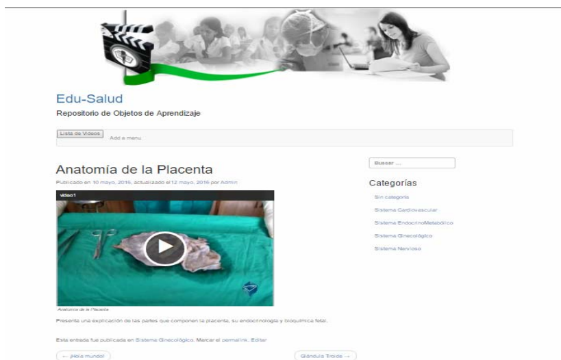
Fig. 2. Vista de listado de videos.

Al dar clic en cualquiera de los vínculos de la lista de videos, se acceda a la página donde se encuentra el video seleccionado (figura 2) se muestra en la columna izquierda el visor de videos que al dar clic se activa este, tiene las opciones de pausar el video, subir o bajar el volumen o ponerlo en pantalla completa, debajo una pequeña descripción de lo que trata el video.